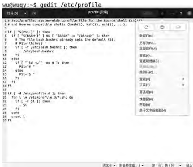
图 5-38 字符界面环境下使用 gedit

如果在字符界面环境下,可以直接运行 gedit 命令打开编辑器,也可以运行 gedit 后面跟上要指定文件下的文件名,直接打开文件。图 5-38 为在字符界面环境下使用 gedit 指定文件夹 etc 打开 profile 的情况。